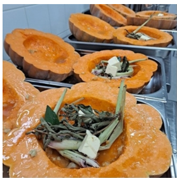
RESTAURATION D'ENTREPRISE Engagée et Responsable

Notre partenaire & associé LECOINTRE PARIS, acteur engagé de la restauration d'entreprise francilienne, œuvre chaque jour pour une alimentation plus saine et responsable auprès de ses 3500 convives, travaillant entre autres chez CHANEL, COCA-COLA, VINCI immobilier, Les Laboratoires ROCHE ou encore PARFUMS CHRISTIAN DIOR. Ainsi leurs Chefs cuisiniers au parcours étoilé s'attachent à travailler 100% de produits frais & de saison , et notamment les variétés paysannes pour leurs qualités gustatives intenses & leurs bienfaits nutritionnels retrouvés !